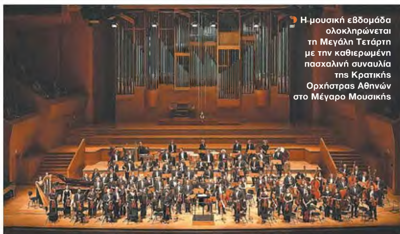
▶ Η μουσική εβδομάδα ολοκληρώνεται τη Μεγάλη Τετάρτη με την καθιερωμένη πασχαλινή συναυλία της Κρατικής Ορχήστρας Αθηνών στο Μέγαρο Μουσικής