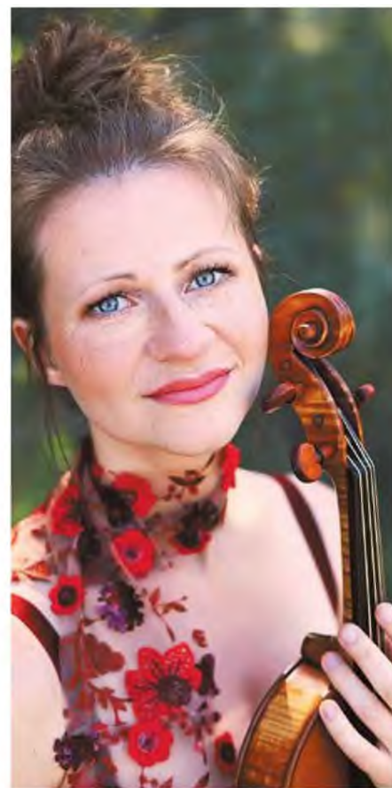
Μια συναυλία αφιερωμένη στην ειρήνη με σολίστ τη βιολονίστρια Λιβ Μίγκνταλ παρουσιάζουν η Κρατική Ορχήστρα Θεσσαλονίκης και η Εθνική Λυρική Σκηνή τη Μεγάλη Τρίτη