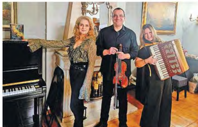
▶ Το Maiandros Ensemble παρουσιάζει απόψε τη μουσική παράσταση «Mater Dolorosa: Η Μητέρα των Αναστεναγμών» στην αίθουσα «Γιάννης Μαρίνος» του Μεγάρου Μουσικής Αθηνών