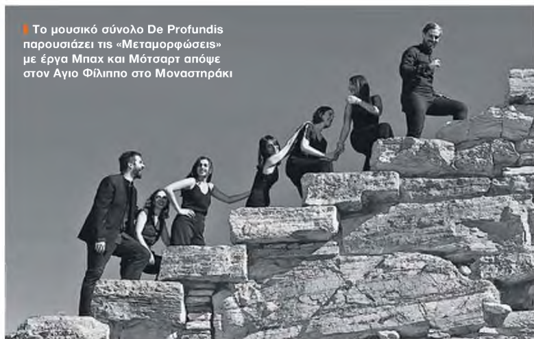
▶ Το μουσικό σύνολο De Profundis παρουσιάζει τις «Μεταμορφώσεις» με έργα Μπαχ και Μότσαρτ απόψε στον Άγιο Φίλιππο στο Μοναστηράκι